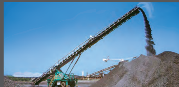
TBL5 搬送能力500t/h オプション:コンベヤ折畳み・散水装置