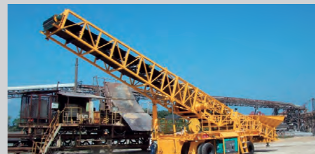
TBL8 搬送能力800t/h ※給電式