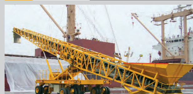
TBL12 搬送能力1200t/h オプション:揺動シュート