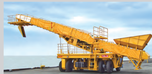
TBL5 搬送能力500t/h オプション:旋回シュート