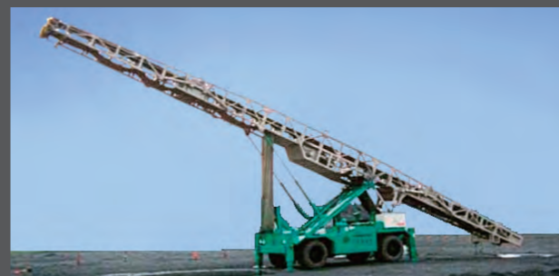
TBL3 搬送能力300t/h オプション:コンベヤ折畳み