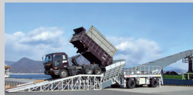
TBL3 搬送能力300t/h オプション:伸縮旋回シュート