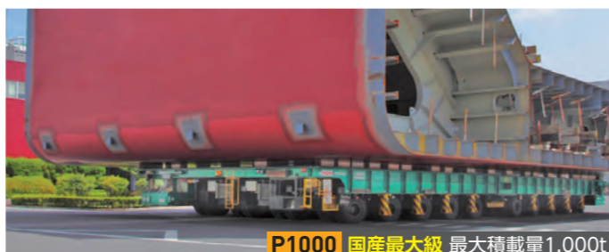
P1000 国産最大級 最大積載量1,000t